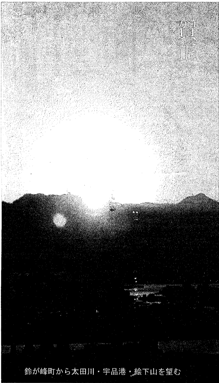
鈴が峰町から太田川・宇品港・絵下山を望む

[発行] 鈴が峰地区社会福祉協議会 広報紙編集委員会 TEL & FAX 209-0331 Email suzugamine-shakyo@nifty.com